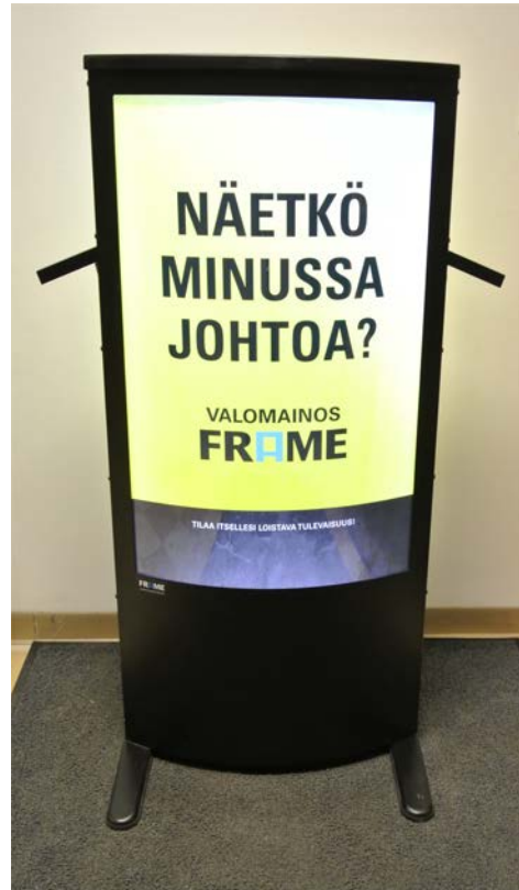
FRAME toiminnassa kantokahvat esillä