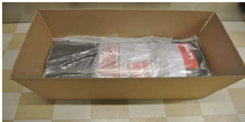
Toimituspakkaus sisältä, mukana kuplamuovi laitteen suojana