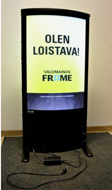
FRAME ja laturi